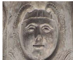
Mascherone in gesso sullo stemma posto all'interno del portone dell'ex casa Sala. Mormanno, Via Faro.