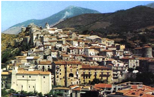
Scalea. Panorama In basso a sinistra la chiesa di S. Nicola in Plateis del secolo VIII, rinnovata nei secoli XII, XIV e XVIII

Appartengono al XIII secolo i resti murari della Grancia e del convento di San Francesco.