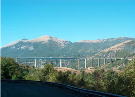
Il ponte Italia della A3 Salerno-Reggio Calabria visto da Laino Castello. Attraversa il Lao in località Capammare.

Il castello divenne da ultimo proprietà della famiglia De Cardenas che lo tenne fino al 1812 21 anno in cui, insieme ad altri beni, passò agli Spinelli principi di Scalea ed ai Pignatelli.