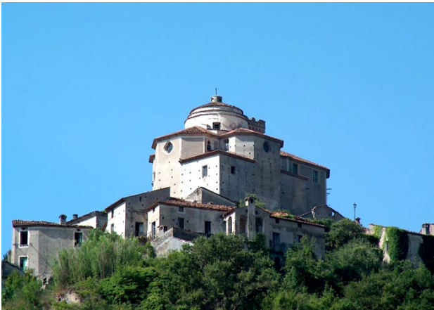
La vecchia chiesa di San Teodoro che per l'arditezza della sua costruzione e posizione è un vero gioiello di architettura.

Lo ringrazio e mi auguro che si realizzino i previsti progetti perché un posto così bello e suggestivo diventi una San Marino del Sud e richiami schiere di turisti che da tale base possono visitare anche il Parco del Pollino e tutti i suoi tesori.