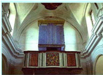
Laino Castello. Chiesa delle Vergini, sec.XV. Al suo interno si nota un organo positivo opera di falegnameria meridionale.

La bella e fresca giornata m'invita a fare una passeggiata. Dopo il ponte di ferro sotto cui passa lo spumeggiante Lao che qui separa i due comuni autonomi dal 19 ottobre 1947, dopo pochi tornanti arrivo alla Chiesa delle Vergini.