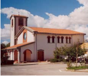
La nuova chiesa di San Teodoro

Penso ad un recupero ed una ristrutturazione del paese, del castello, delle due chiese, soprattutto di S Teodoro che, per l'arditezza della costruzione e la posizione, è un vero gioiello di architettura.